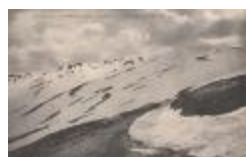
Environs de Colmars-les-Alpes. - La route au Col d'Allos (altitude 2847 m.) (04006-IM-00383)