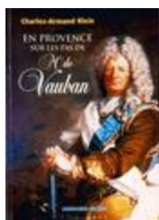
En Provence sur les pas de Mr de Vauban (BIB-1800439)