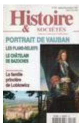
Annales de généalogie et d'héraldique n°69 - Portrait de Vauban (NUM-01474)