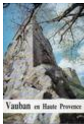
Annales de Haute Provence, tome LII - n°296 - Vauban en Haute Provence (NUM-01473)