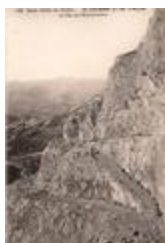
102 - Haute vallée du Verdon - De Colmars au Lac d'Allos - Le Pas de l'Encombrette (04061-IM-00905)