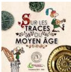
Sur les traces du Moyen âge (BIB-100018)