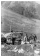
Le Gias de Rochas - 1896 (06056-IM-21497)