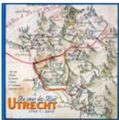
Le siège de Colmars, 1690, dans Au coeur des Alpes : Utrecht (BIB-1800800)