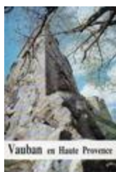
Annales de Haute-Provence (REV-00000193)