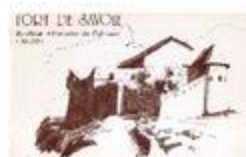
Fort de Savoie - Syndicat d'initiative de Colmars (04370) (BIB-1800904)