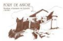
Fort de Savoie (BIB-100034)