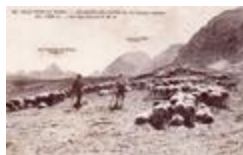
93 Haute-Vallée du Verdon. - Colmars les Alpes (B.A.) - Station estivale - Alt. 1.250 m.. - Col des Champs 2.191 m. (04061-IM-00901)