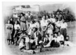
[le comité des fêtes d'Entraunes à Colmars] (06056-IM-00302)