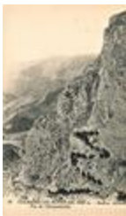
10 - Colmars-Les-Alpes (alt. 1250 m. - Station estivale). Pas de l'Encombrette (04061-IM-00902)