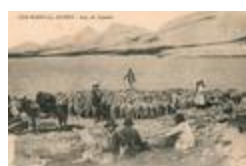
Colmars-Les-Alpes - Lac de Lignin (04061-IM-00904)