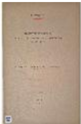
Mathieu d'Anvers - Architecte et sculpteur des Alpes du Sud au XVIe (numérisation) (ART-18003356)