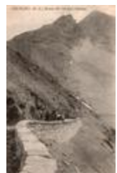
Colmars (B.-A.) Route du Col des Champs (04061-IM-00900)