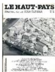
Le Haut-Pays n°1 (NUM-00379)