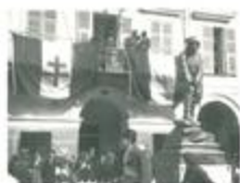
La Brigue à la Libération - 1945 (06162-IM-00678)