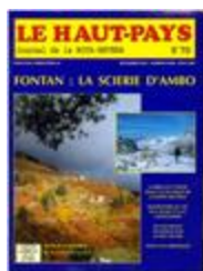
Le Haut-Pays n°70 (NUM-00472)