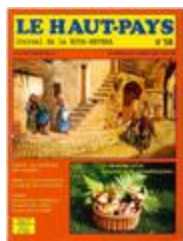
Le Haut-Pays n°58 (NUM-00461)