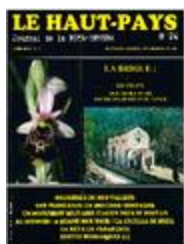
Le Haut-Pays n°24 (NUM-00449)