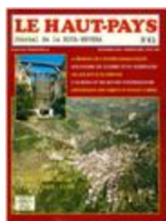
Le Haut-Pays n°61 (NUM-00463)