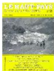
Le Haut-Pays n° 15 (NUM-00440)