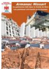
Armanac Nissart - 2023 - Le patrimoine bâti dans le Comté de Nice - Lou patrimoni civil bastit en la Countéa (NUM-00793)