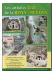
Les annales 2024 de la Roya-Bévéra (NUM-01842)