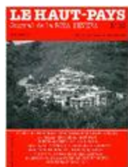
Le Haut-Pays n°10 (NUM-00388)