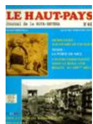
Le Haut-Pays n°60 (NUM-01415)