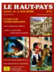
Le Haut-Pays n°51 (NUM-00455)