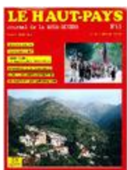
Le Haut-Pays n°41 (NUM-00430)