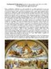
La dispute du St Sacrement, huile sur bois, anonyme, non datée, vers 1520. Cathédrale Ste Réparate, croisillon nord, Nice, ou l'affirmation d'une Eglise triomphante (ART-18003119)