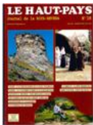
Le Haut-Pays n°38 (NUM-00428)