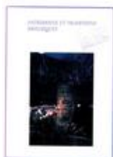
Patrimoine et traditions brigasques (BIB-002200)