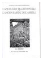
L'apiculture traditionnelle et l'ancien habitat de l'abeille . (BIB-001803)