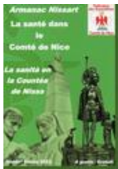
Armanac nissart - 2022 - La santé dans le Comté de Nice (NUM-00883)