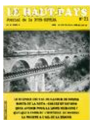
Le Haut-Pays n°21 (NUM-00446)