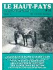
Le Haut-Pays n°18 (NUM-00443)