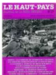
Le Haut-Pays n°17 (NUM-00442)