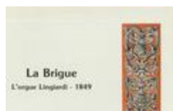
La Brigue. L'orgue Lingiard - 1849 (BIB-011341)