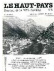
Le Haut-Pays n°5 (NUM-00383)