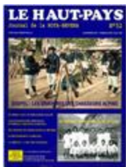
Le Haut-Pays n°52 (NUM-00456)