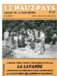
Le Haut-Pays n°20 (NUM-00445)