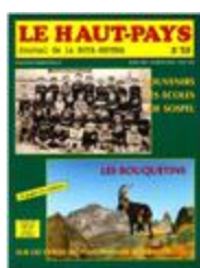
Le Haut-Pays n°59 (NUM-00462)