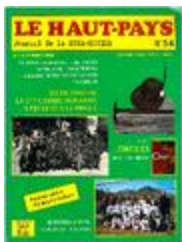
Le Haut-Pays n°54 (NUM-01231)