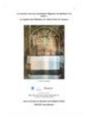
La rencontre entre une communauté villageoise, une épidémie et un peintre: La Chapelle Saint-Sébastien dite Sainte-Claire de Venanson (ART-18003216)