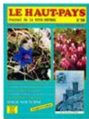
Le Haut-Pays n°56 (NUM-00459)