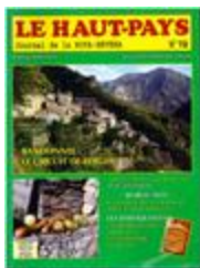
Le Haut-Pays n°72 (NUM-00857)