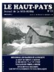
Le Haut-Pays n°23 (NUM-00448)