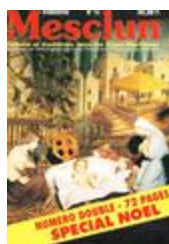
Mesclun n°12 - Numéro double - 72 pages - Spécial Noël (NUM-00100)