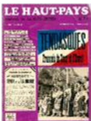
Le Haut-Pays n°39 (NUM-01230)