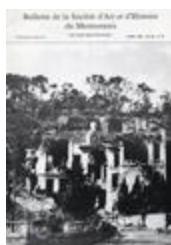
Bulletin de la Société d'art et d'histoire du Mentonnais n° 38 - Juin 1986 (NUM-01547)