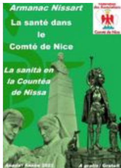
Armanac Nissart - 2022 - La santé dans le Comté de Nice - La sanità en la Countéa de Nissa (NUM-00792)