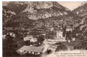
1372 - St. Martin-Vésubie (A.-M.) - Les villas - Route de Venanson (06127-IM-00908)