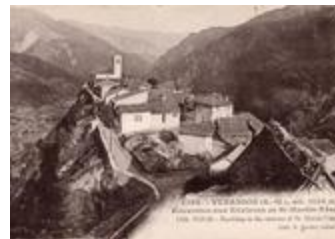
1398 - Venanson (A.-M.) , alt. 1130 mètres - Excursion aux environs de St-Martin-Vésubie - (Alt. 3723 ft) - Rambling to the environs of St. Martin-Vésubie (06156-IM-00913)