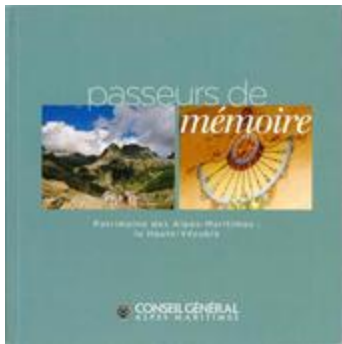
passeurs de mémoire Patrimoine des alpes-Maritimes: La Haute - Vésubie (BIB-1800505)