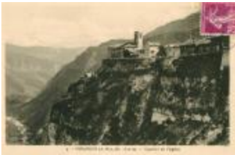
4. - VENANSON (A.-M.), alt. 1130 m. - Quartier de l'Eglise (06156-IM-00905)