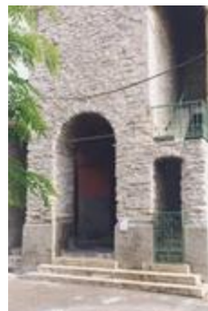
Eglise paroissiale Saint-Michel (06156-ARC-10141)