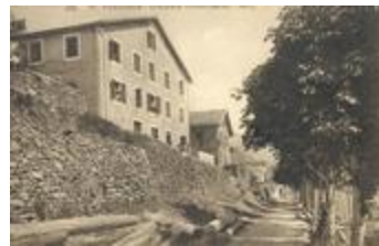
67 - Venanson - colonie Condamine - Nice (06156-IM-21339)