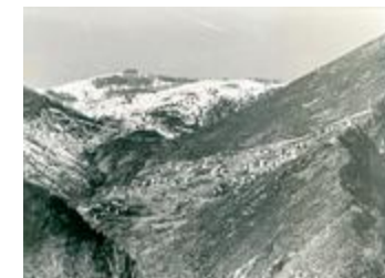
Venanson. Vue prise vers le Nord-Ouest, en février (06156-IM-21427)