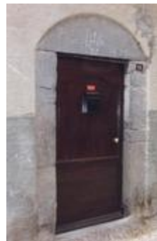
Porte encadrée n° 3 (06156-ARC-10130)