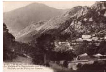
3467- St. Martin-Vésubie (A.-M.) - La Vallée et la Promenade sur Venanson. The valley and the walking over Venanson (06127-IM-00966)