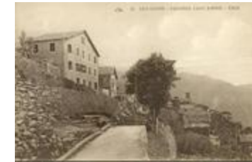
65 - Venanson - colonie Condamine - Nice (06156-IM-21337)