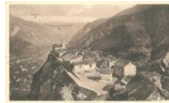
18 - Saint-Martin-Vésubie - Venanson (06156-IM-21340)