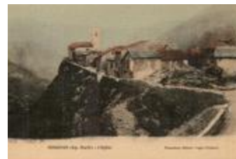
Venanson (Alp.- Marit.) - L'Eglise (06156-IM-00910)