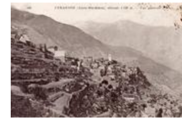
240 - Venanson (Alpes-Maritimes), altitude 1.130m. - Vue générale (06156-IM-00907)