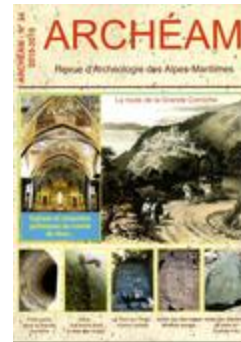
Archéam n° 24 - 2018/2019 - La Grande Corniche (I), la grande route du Premier Empire - La Grande Corniche (II), le