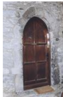
Porte encadrée n° 4 (06156-ARC-10131)