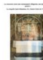
La rencontre entre une communauté villageoise, une épidémie et un peintre: La Chapelle Saint-Sébastien dite Sainte-Claire