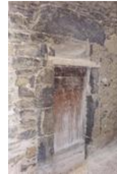
Porte encadrée n° 1 (06156-ARC-10128)