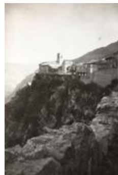
Venanson - 1949 (06156-IM-21343)