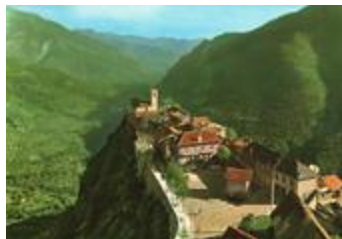
Venanson - 06 - Alpes-Maritimes - Altitude 1150 mètres - Curieux village situé sur un piton rocheux dominant Saint-Martin-Vésubie et la vallée de la Vésubie (06156-IM-00912)