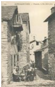
241 - Alpes-Maritimes - Venanson rue saint jean (06127-IM-21335)