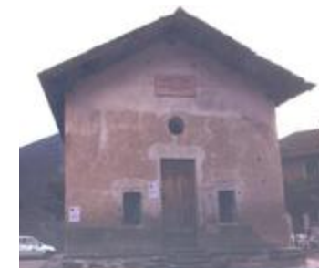
Chapelle Saint-Sébastien ou chapelle Sainte-Claire (06156-ARC-10169)