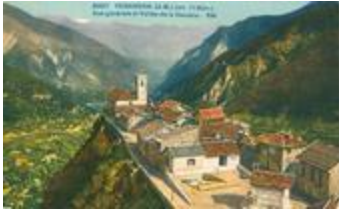
3057 - Venanson (A.-M.) (alt.1130 m.) - Vue générale et Vallée de la Vésubie (06156-IM-21341)