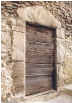
Porte encadrée n° 2 (06156-ARC-10129)