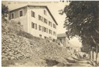
66 - Venanson - colonie Condamine - Nice (06156-IM-21338)