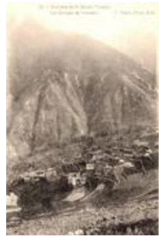
13. Environs de St-Martin-Vésubie - Les Granges de Venanson (06156-IM-00911)