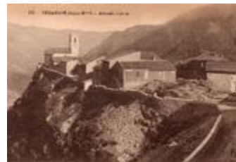
177 - Venanson (Alpes-Mmes) - Altitude 1130 m. (06156-IM-00909)