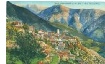
3015 - Venanson (A.-M.) (alt.1130 m.) - Vue générale (06156-IM-21342)