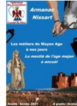
Armanac Nissart - 2021 - Les métiers du Moyen-Age à nos jours (NUM-00791)