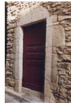
Porte encadrée n° 5 (06156-ARC-10132)